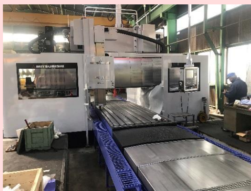
新しく導入した設備 (五面加工機)